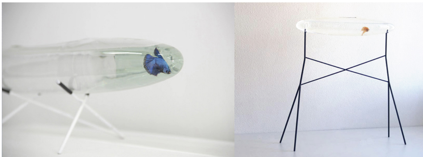
AIR 1 & AIR 2 , 2009