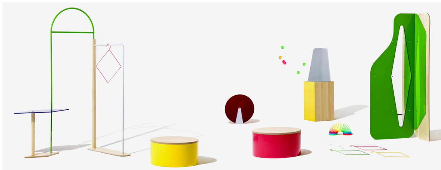
OBJET COLORÉ , 2012