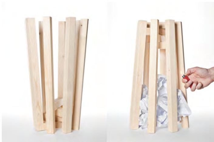
Corbeille . Corbeille à papier en sapin ou frêne, 32 x 52 cm