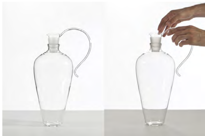
Histoires , carafe en verre, pièce unique, hauteur 40 cm