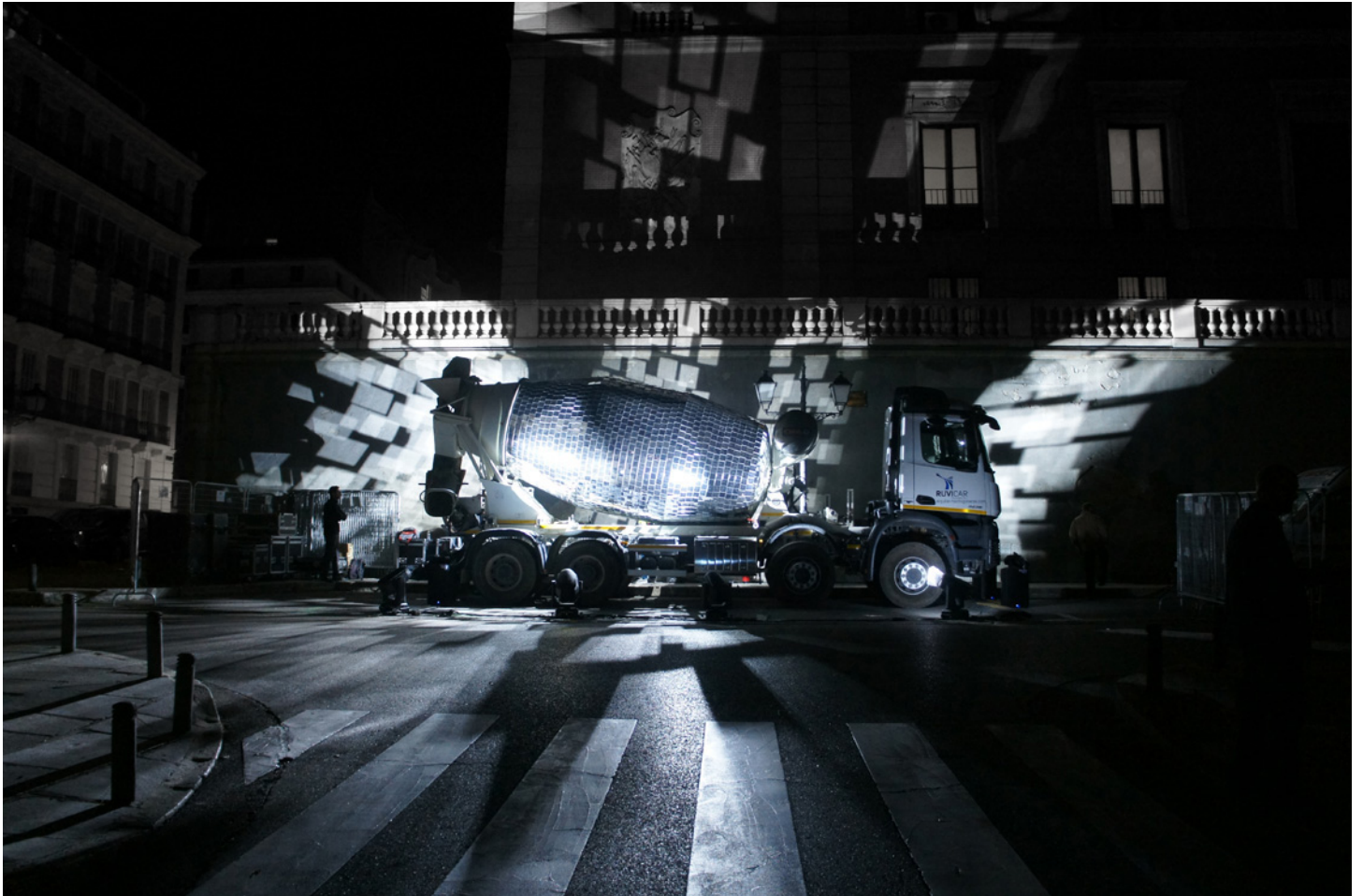
Vue de l'installation, Luna de Octubre , Madrid, 2017