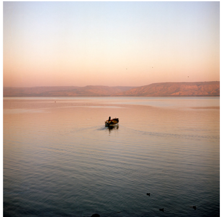
Sur les traces de Jesus de Nazareth , 2011 Ensemble de 25 photographies, argentique, couleur, dimensions variables