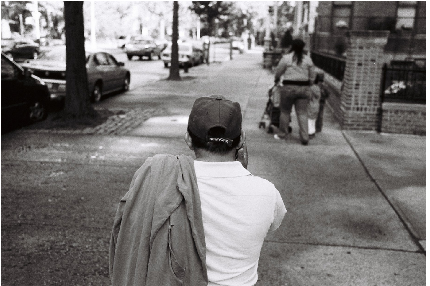
Pâques à New York, Blaise Cendrars, 2009