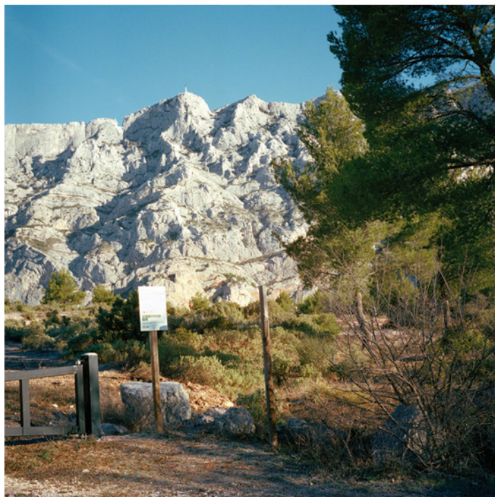
Le passé composé, l'éducation photographique à la française, 2014