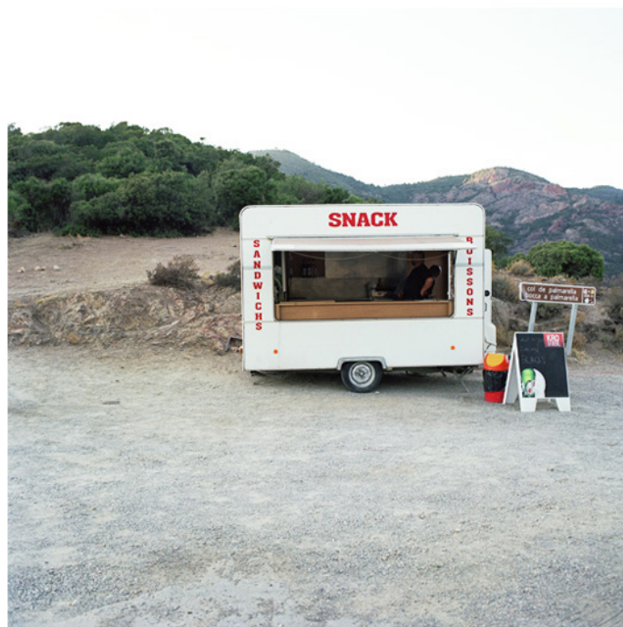
Lumière d'août : récits de Corse , 1998-2006