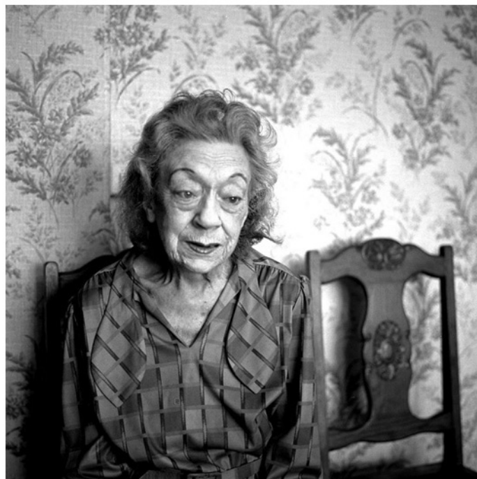
Les oubliés , 1990-1997

Extrait d'un ensemble photographique Argentique, N&B, dimensions variables