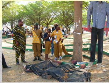
Installation de Grek et Adogra