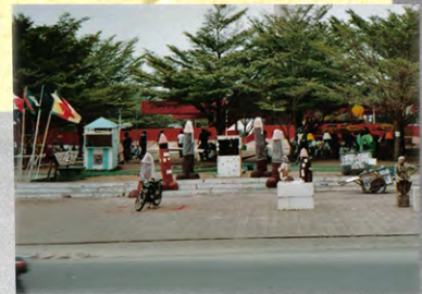
Vue d'ensemble, "Pour lutter contre le sida", Makef.