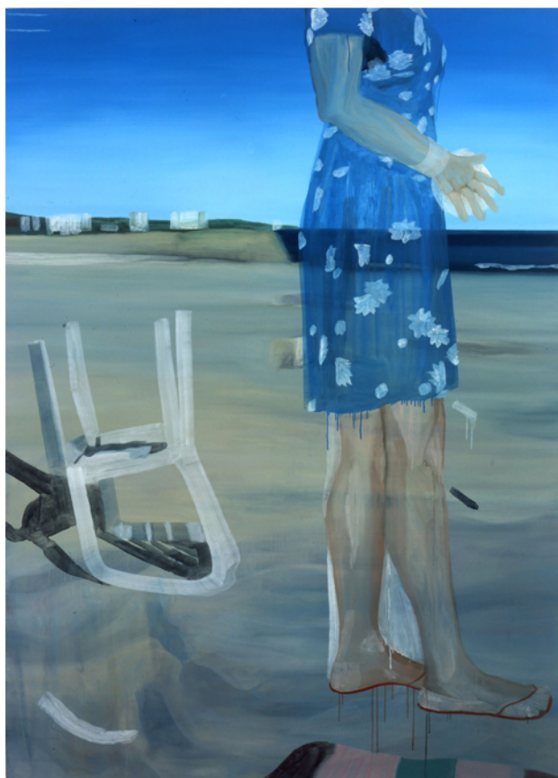
Sans titre, 2001 huile sur toile, 200 x 140 cm Collection particulière