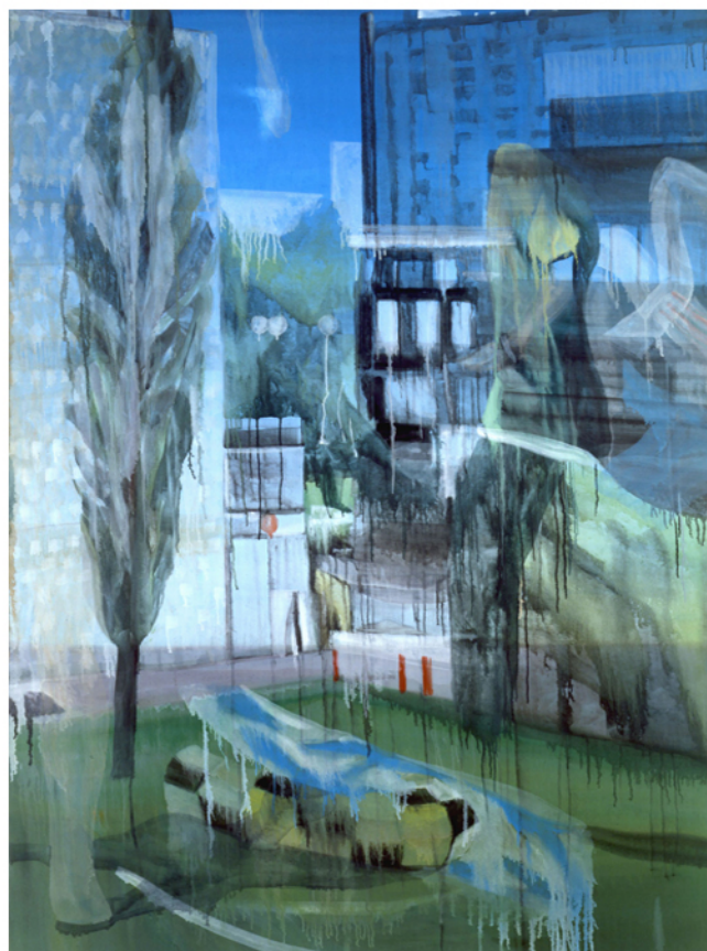
Sans titre, 2007 huile sur toile, 200 x 150 cm Collection particulière