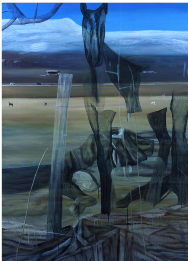
Sans titre, 2000 huile sur toile, 200 x 150 cm, Collection particulière