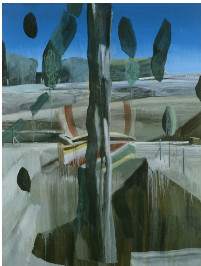
Sans titre, 2011 huile sur toile, 200 x 150 cm Collection particulière