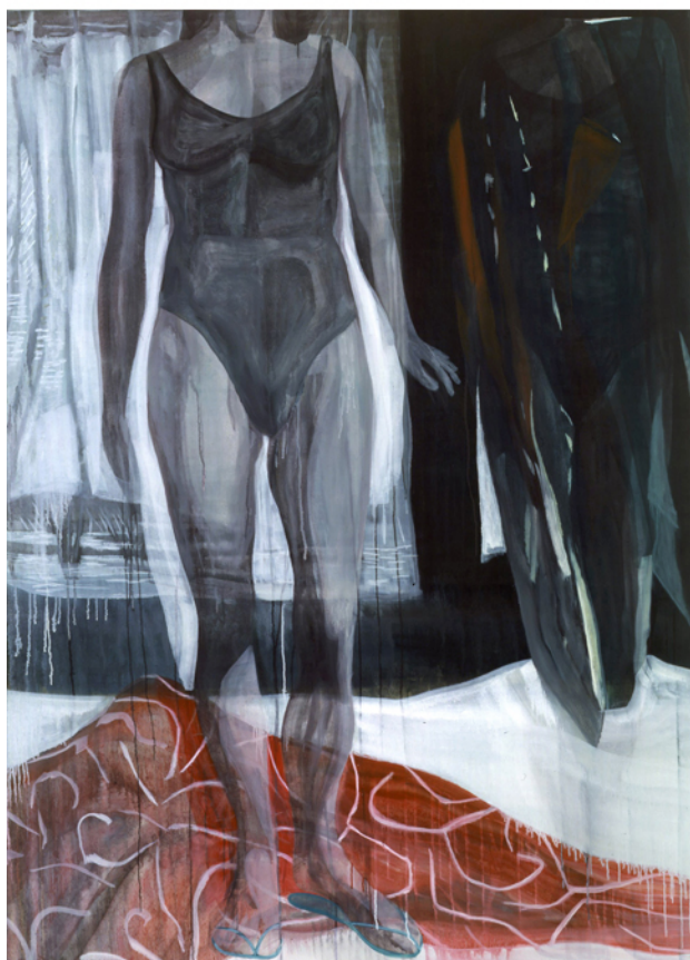
Sans titre, 2008 huile sur toile, 200 x 150 cm Collection particulière