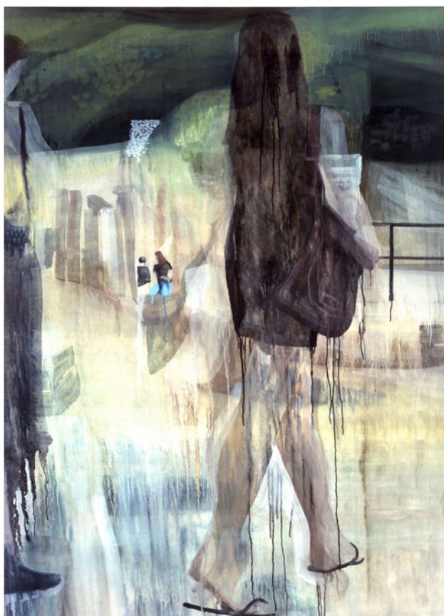
Sans titre, 2006 huile sur toile, 195 x 130 cm, Collection particulière