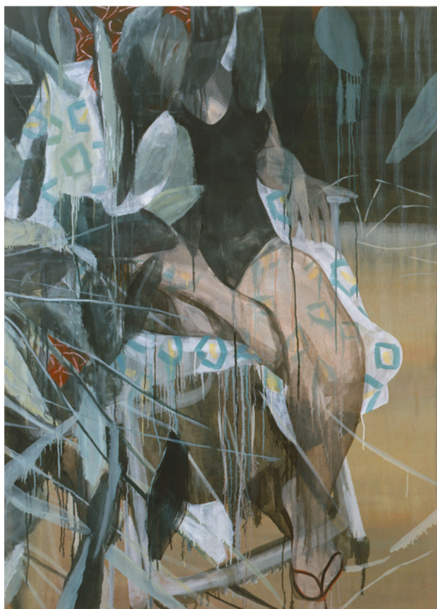
Sans titre, 2008 huile sur toile, 162 x 114 cm Collection particulière