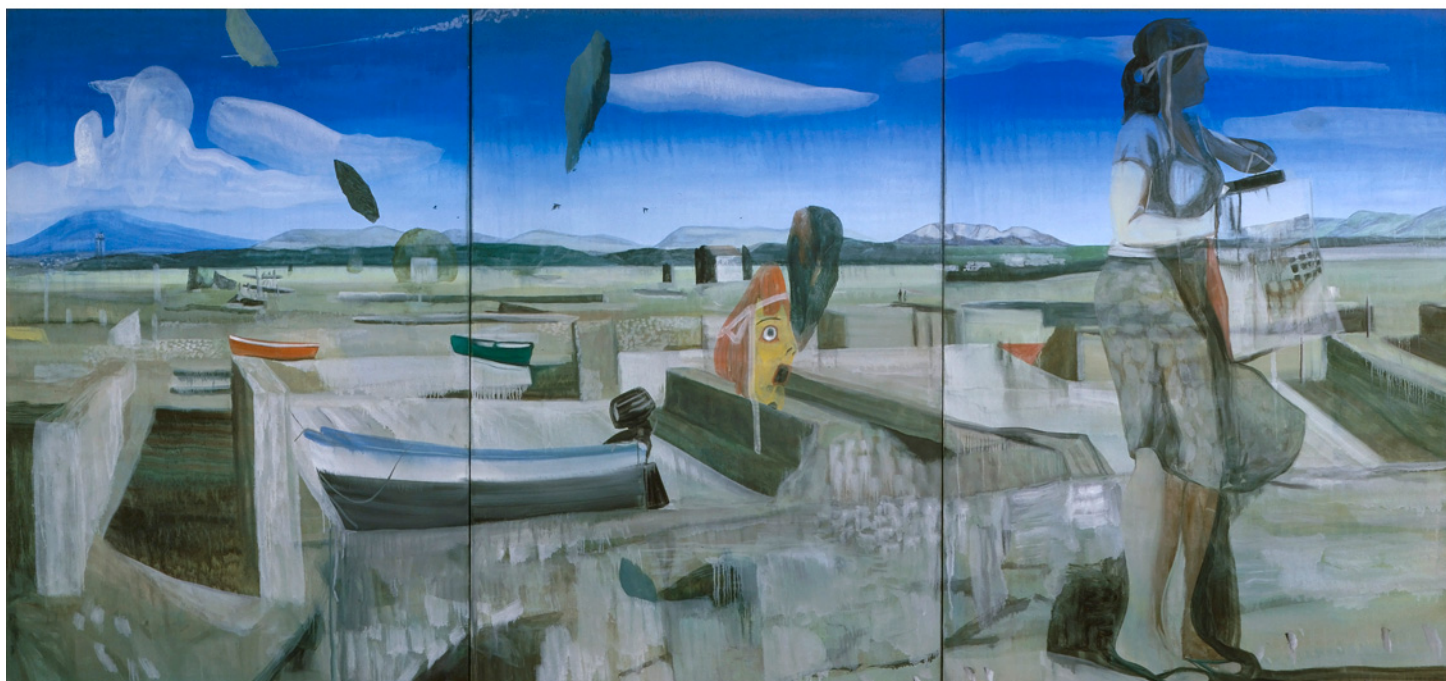
Sans titre, 2010 huile sur toile, 200 x 430 cm, triptyque Collection particulière