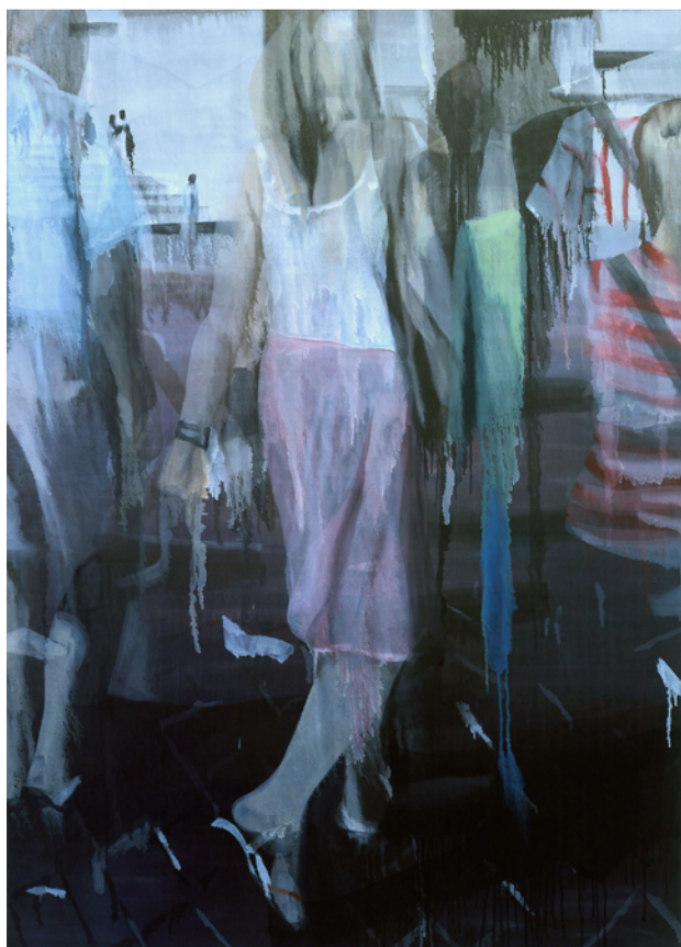
Sans titre, 2006 huile sur toile, 200 x 150 cm Collection particulière