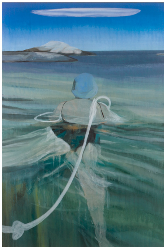
Sans titre, 2011 huile sur toile, 195 x 130 cm Collection Carré d'Art - Musée d'Art Contemporain de Nîmes