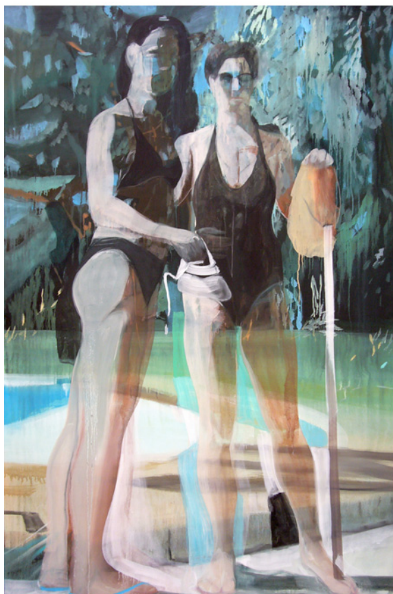
Sans titre, 2011 huile sur toile, 195 x 130 cm Collection particulière