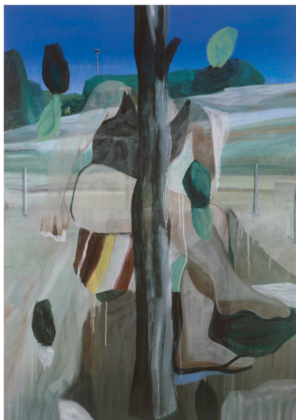
Sans titre, 2011 huile sur toile, 162 x 114 cm Collection particulière