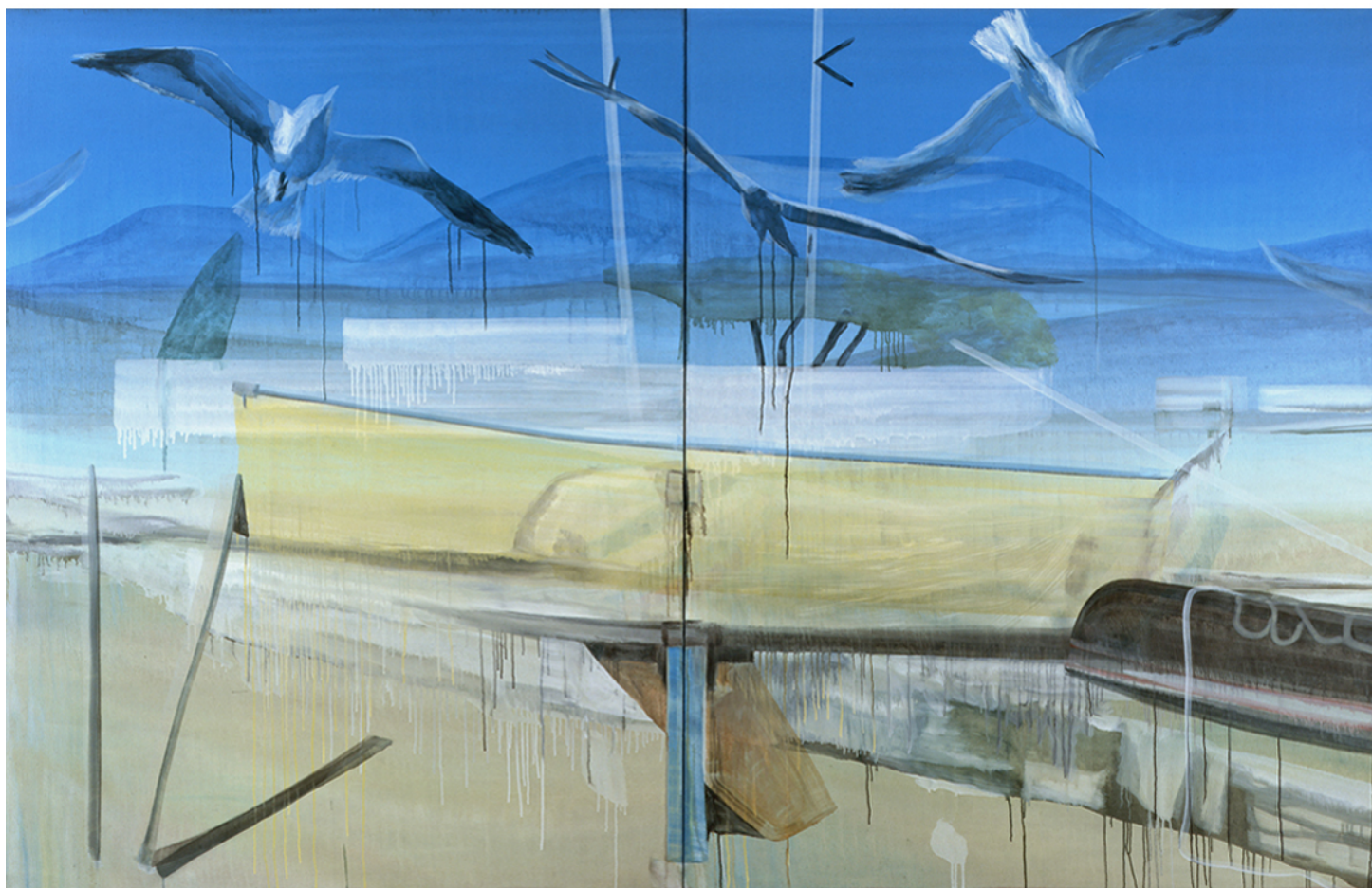
Sans titre, 2009 huile sur toile, 200 x 300 cm, diptyque Collection particulière