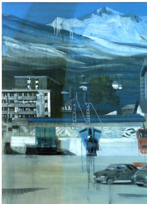
Sans titre, 2008 huile sur toile, 200 x 140 cm, Collection particulière